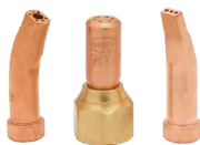
6290-G 6290-HA 6290-R