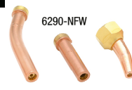
6290-NFW 6290-GG 6290-2NFFR