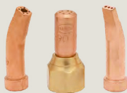
6290-G 6290-HA 6290-R