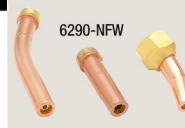
6290-NFW 6290-GG 6290-2NFFR